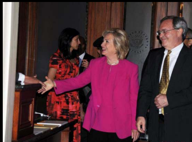
2015年10月22日，接受众议院班加西调查委员质询