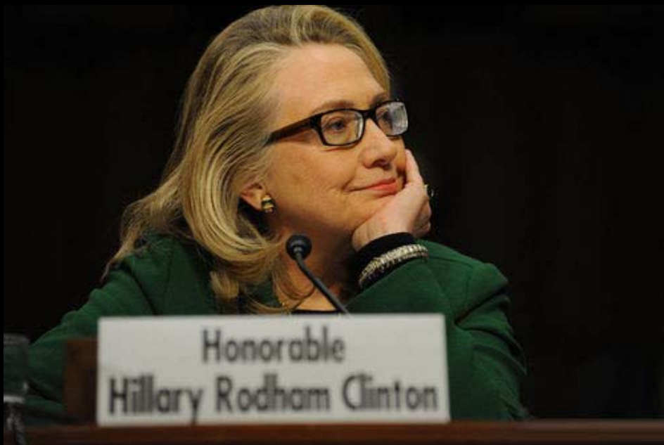
2013年1月23日，接受参议院外交关系委员会质询